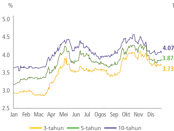
CARTA 1 Hasil MGS

Bon dan sukuk korporat kekal berdaya tahan. Kadar mungkir yang rendah sebanyak 0.18% (2021: 0.17%).