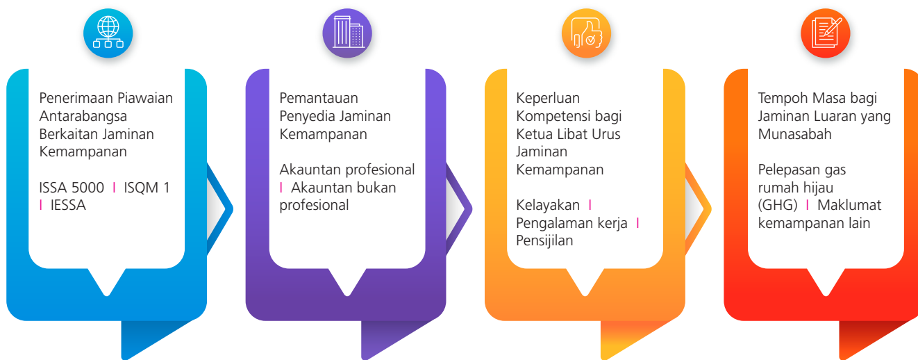
Elemen Utama Cadangan Rangka Kerja

Sepanjang tempoh rundingan awam, AOB telah berinteraksi dengan wakil kanan daripada lima penyedia jaminan kemampanan bukan perakaunan yang beroperasi di Malaysia. Libat urus ini bertujuan mendapatkan gambaran mengenai amalan jaminan kemampanan semasa, keupayaan teknikal, cabaran yang dihadapi serta tahap kesiapsiagaan mereka untuk mematuhi cadangan Rangka Kerja tersebut.