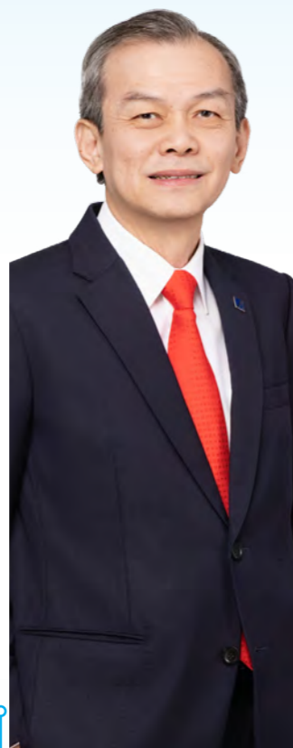
TAN SRI WEE HOE SOON @ GOOI HOE SOON